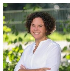
S. Peyré SoPäDie Einschulung