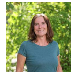
A. Rohwetter GS Langhurst GS Schutterwald GS Diersburg