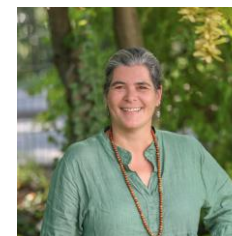
C. Masius GS Zell-Weierbach GS Rammersweier