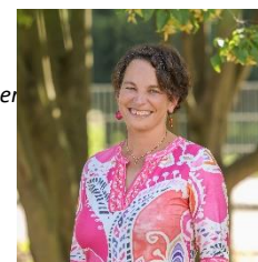
V. Waslikowski GS Anne-Frank