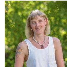
L. Herrel GWRS Georg-Monsch