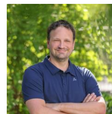
B. Pinggera GS Elgersweier GS Zunsweier GS Fessenbach