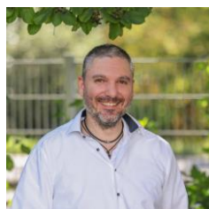
S. Scheibe GS Niederschopfheim GS Hofweier