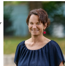
V. Waslikowski GS Anne-Frank