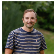
S. Teubner GS Konrad-Adenauer