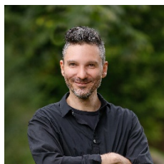
S. Scheibe GS Niederschopfheim GS Hofweier