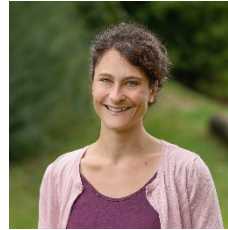
V. Engels GS Diersburg GS Ortenberg