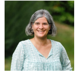
C. Masius GS Zell-Weierbach GS Rammersweier