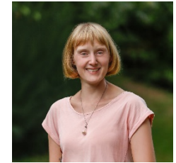
L. Herrel GWRS Georg-Monsch