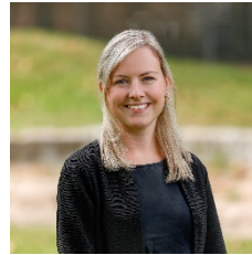
S. Latt SoPäDie Einschulung