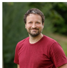
B. Pinggera GS Elgersweier GS Zunsweier GS Fessenbach