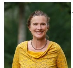
A. Rohwetter GS Langhurst GS Schutterwald